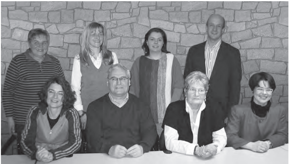
Ihr Vorstandsteam des TV Soden-Stolzenberg

Abschließend wünschen wir allen Mitgliedern, Freunden und Gönnern eine friedvolle und möglichst stressfreie Vorweihnachtszeit, frohe Festtage und für das Jahr 2015 alles Gute.